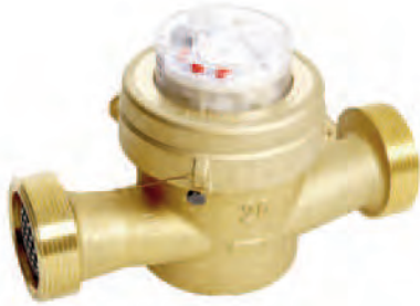
FILETTATO - THREADED