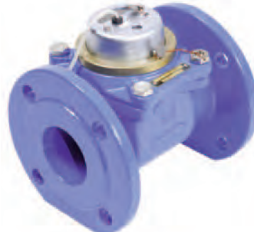
FLANGIATO - FLANGED