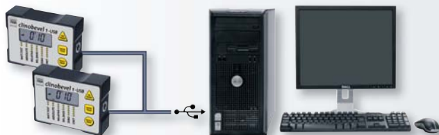
Funciones posibles: A ; B ; A+B ; A-B

Se pueden realizar múltiples aplicaciones, como la medida de 2 planos por comparación de los valores medidos con 2 instrumentos o creación automática de informes de medida en Microsoft EXCEL.