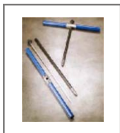
BS001 A BS108B