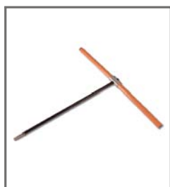
BS400 A BS425