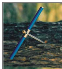
BS260 A BS262F