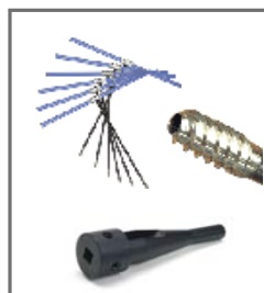
BS201 A BS201D